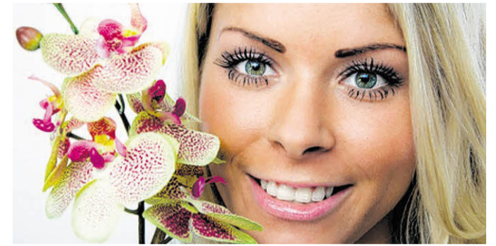
Faszinierende Wimpern kann jeder haben.

Bei Vorlage des nebenstehenden Coupons erhalten diese die dort näher bezeichneten Sonderkonditionen auf verschiedene Dienstleistungen. Die Angebote des Coupons sind einzeln oder kombiniert nutzbar. Terminreservierung für den Salon Halle-Südstadt bitte unter Telefon 03 45 - 68 54 76 00, für den Salon Halle-Büschdorf 03 45 - 68 44 94 80, für den Salon in Leuna unter 0 34 61 - 43 44 61 oder direkt online auf www.haarwelten.com .